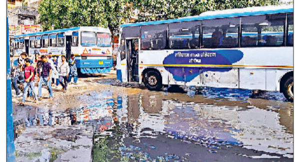
सोनीपत। मुख्य द्वारा के पास यात्रियों को बैठाने के लिए लगाई बस व जैसीबी से मिट्टी डालकर रास्ता बंद करते कर्मचारी।

सुबह कर्मचारी और यात्री बस अड्डे पर पहुंचे तो बस अड्डा तालाब बना नजर आया। जिससे कर्मचारियों व यात्रियों को खासी परेशानियों का सामना करना पड़ रहा है। हालात यह रहे कि बस अड्डे पर कार्यशाला में खड़ी कर्मचारी की कार पानी भरने के कारण यहीं फंसी रह गई। वहीं बस अड्डे से उत्तर प्रदेश राजस्थान, जम्मू, शिमला, दिल्ली