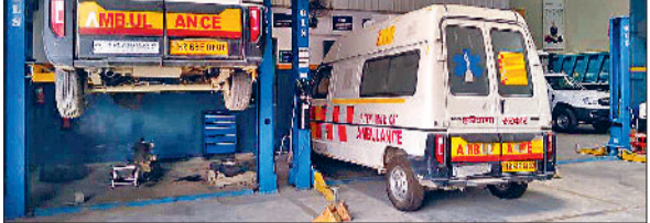
सोनीपत। गैराज में खड़ी एंबुलेंस।

इंतजार करना पड़ रहा है। ऐसे में गर्भवती महिला को हालत गंभीर बताकर रेफर करने पर उनकी जान को जोखिम में डाला जा रहा है। परेशानी तीमारदार निजी एंबुलेंस या निजी वाहन में जाने पर मजबूर हो रहे हैं। बता दें कि जिले में बेहतर सुविधाएं देने के लिए स्वास्थ्य विभाग की तरफ से जीवनवाहिनी (एंबुलेंस) को तैनात किया है। जोकि घायलों व अस्पताल में गंभीर हालत के चलते रेफर होने वाली गर्भवती महिलाओं व घायलों को पीजीआई व अन्य बड़े अस्पतालों में