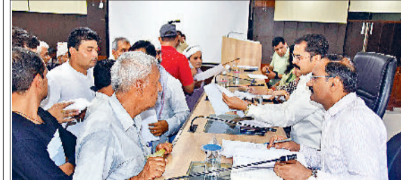
सोनीपत। समाधान शिविर में लोगों की समस्याएं सुनते हुए अधिकारीगण।