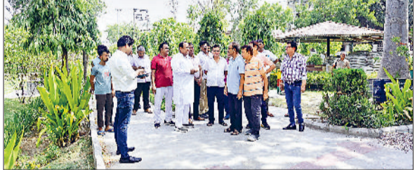
सोनीपत। विधायक सुरेंद्र पंवार जैश पार्क में समस्याएं सुनते हुए।

हुआ है, जिसकी वजह से बिजली की तारों भी पार्क के अंदर से क्रॉस की हुई हैं। इसकी वजह से कई बार हादसे की संभावना बनी रहती है। बिजली के तार तेज हवा में आपस में कनेक्ट हो जाते हैं, जिसकी वजह से चिंगारियां उठ जाती हैं। इसके साथ ही कई बार बच्चे पार्क में खेलते समय ट्रांसफार्मर के पास पहुंच जाते हैं। क्षेत्रवासी समस्या के बारे में प्रशासन को भी अवगत करवा चुके हैं, लेकिन समस्या जस की तस बनी रहती है। विधायक सुरेंद्र पंवार ने मौके पर ही बिजली निगम के अधिकारियों को ट्रांसफार्मर व बिजली की तारों शिफ्ट करने के निर्देश दिए। उन्होंने कहा कि शहर के अंदर जितने भी पार्क हैं बिजली निगम को एक सर्वे करवाकर उन पार्कों के अंदर से बिजली की तारों व ट्रांसफार्मर शिफ्ट करवाने चाहिए।